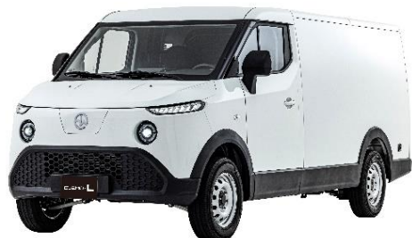
車両本体価格：4,950,000円（税込）【リース料総額：1,072,800円（税込）】