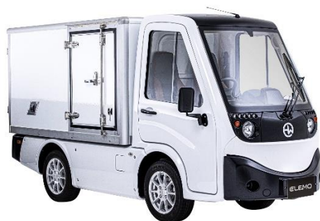
車両本体価格：3,311,000円（税込）/ピックアップ【リース料総額：496,800円（税込）】 ：3,476,000円（税込）/ボックス【リース料総額：568,800円（税込）】