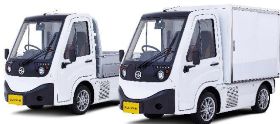
車両本体価格：2,673,000円（税込）/ピックアップ【リース料総額：352,800円（税込）】 ：3,256,000円（税込）/ボックス【リース料総額：460,800円（税込）】